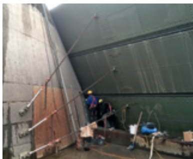
Erneuerung der Stahlpanzerung und Verpressung mit Injektionsharz