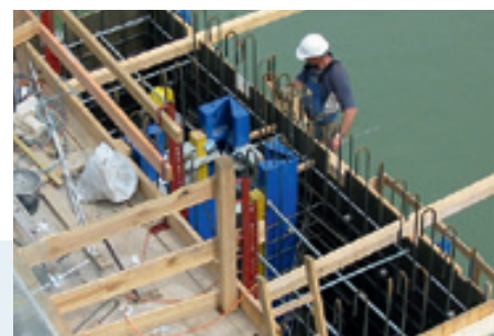
Verstärkung von Wehrpfeilern