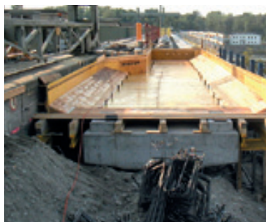
Errichtung eines Brückentragwerkes auf Bohrpfehlen