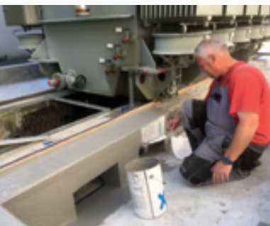
Abdichtung einer Trafwanne mit Flüssigkunststoff