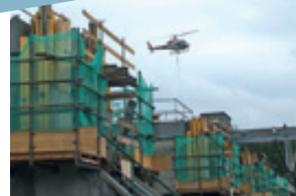
Wehrpfeilverstärkung, Betoneinbau mit Hubschrauber