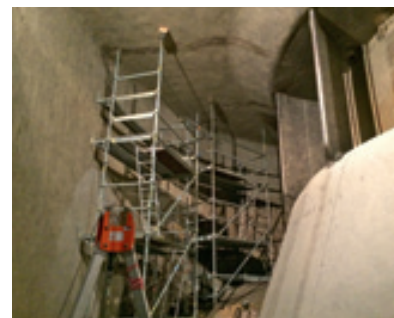
Injektionsarbeiten im Turbinenraum

25 JAHRE KNOW-HOW UND ERFAHRUNG UNSERES TEAMS GARANTIEREN IHNEN VERLÄSSLICHKEIT UND SICHERHEIT.