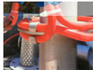
Wanddurchführung System BWI