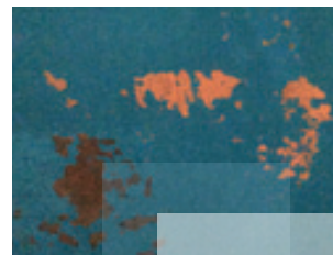
Altbeschichtungen in Wasserkammer – die große Hygienegefahr

Lassen Sie es nicht so weit kommen, setzen Sie rechtzeitig Ihr Trinkwasserbauwerk instand! Wir beraten Sie gerne und koordinieren für Sie professionelle Analysen durch unabhängige Prüfanstalten.